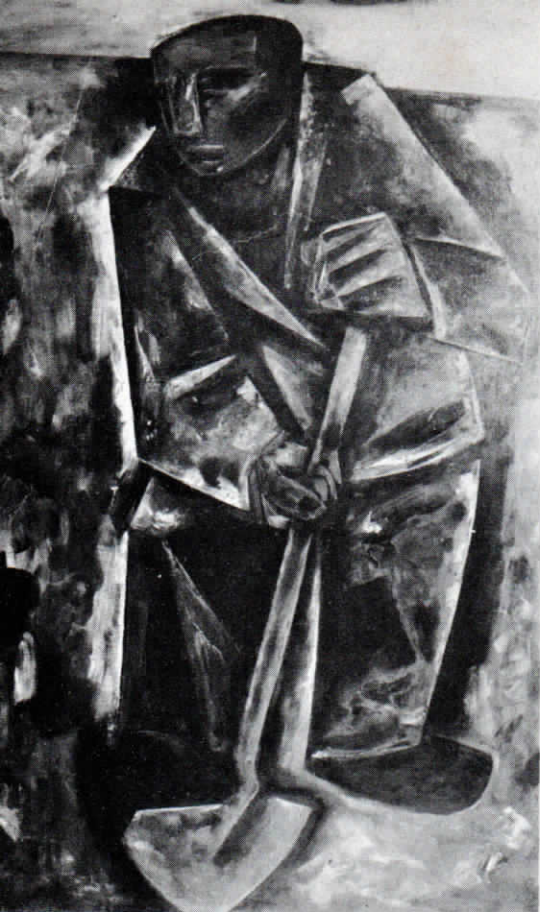
Maurice Rocher : L'Homme à la bêche (1954)

L'art de Rocher est très personnel ; il engage l'être tout entier ; il faut savoir l'écouter, pour se rendre compte que les états d'âme du peintre peuvent aussi bien être les nôtres, pour percevoir à travers les contrastes de clair-obscur qu'il met en jeu, le combat mené par l'ange de la vie et celui du péché, qu'un sentiment de compassion unit souvent en une même miséricorde.