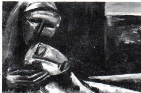
Maurice Rocher : Mise au tombeau (1955)

L'art de Rocher est très personnel ; il engage l'être tout entier ; il faut savoir l'écouter, pour se rendre compte que les états d'âme du peintre peuvent aussi bien être les nôtres, pour percevoir à travers les contrastes de clair-obscur qu'il met en jeu, le combat mené par l'ange de la vie et celui du péché, qu'un sentiment de compassion unit souvent en une même miséricorde.